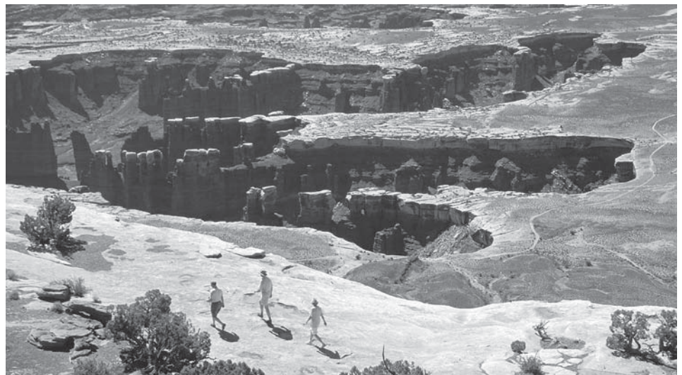
Grand View Point, Island in the Sky

Die Felshänge und Klippen sind die bevorzugte Heimat für viele Dickhornschafe, die im Canyonlands National Park leben. Vom Island in the Sky Tafelberg sehen diese Tiere aus wie braune, fliegengrosse Flecken, die nur der schärfste Beobachter entdecken wird. Die vielen Wege und Pfade auf Island in the Sky eignen sich gut für Beobachtungen von Tieren, besonders in den frühen Morgenstunden, in der Dämmerung oder in den kühleren Monaten.